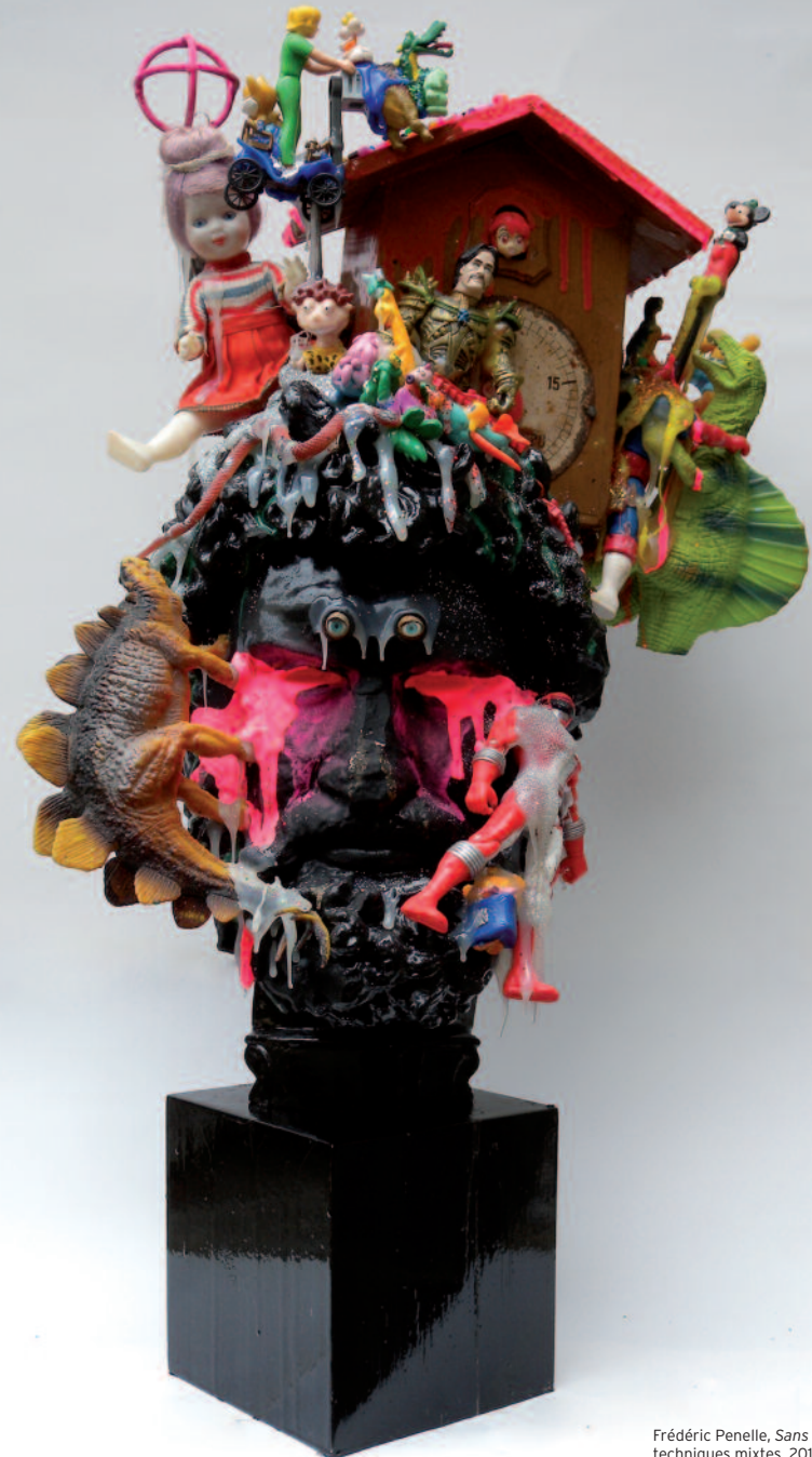
Frédéric Penelle, Sans titre , techniques mixtes, 2011

Entrée libre, du lundi au vendredi de 9 h à 19 h, samedi et dimanche de 11 h à 19 h